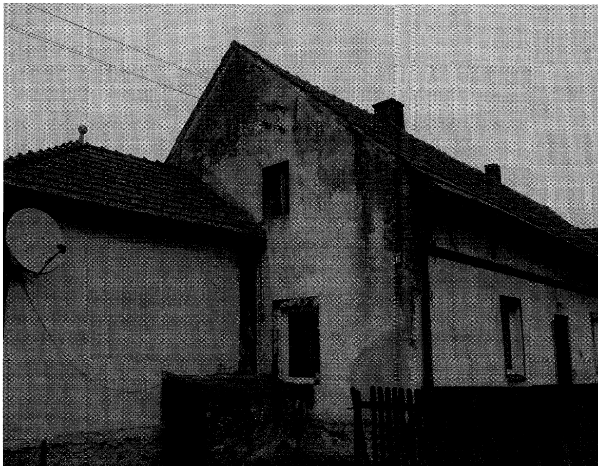
Rysunek 3 Budynek Mienia Gminnego w Jasioniej.

W Jasionej ulica Polna 18 działka nr 423/7 o powierzchni 628m/kw z gminną drogą dojazdową nr działki 414/7 o powierzchni 470 m/kw widok zdjęcie nr 3.