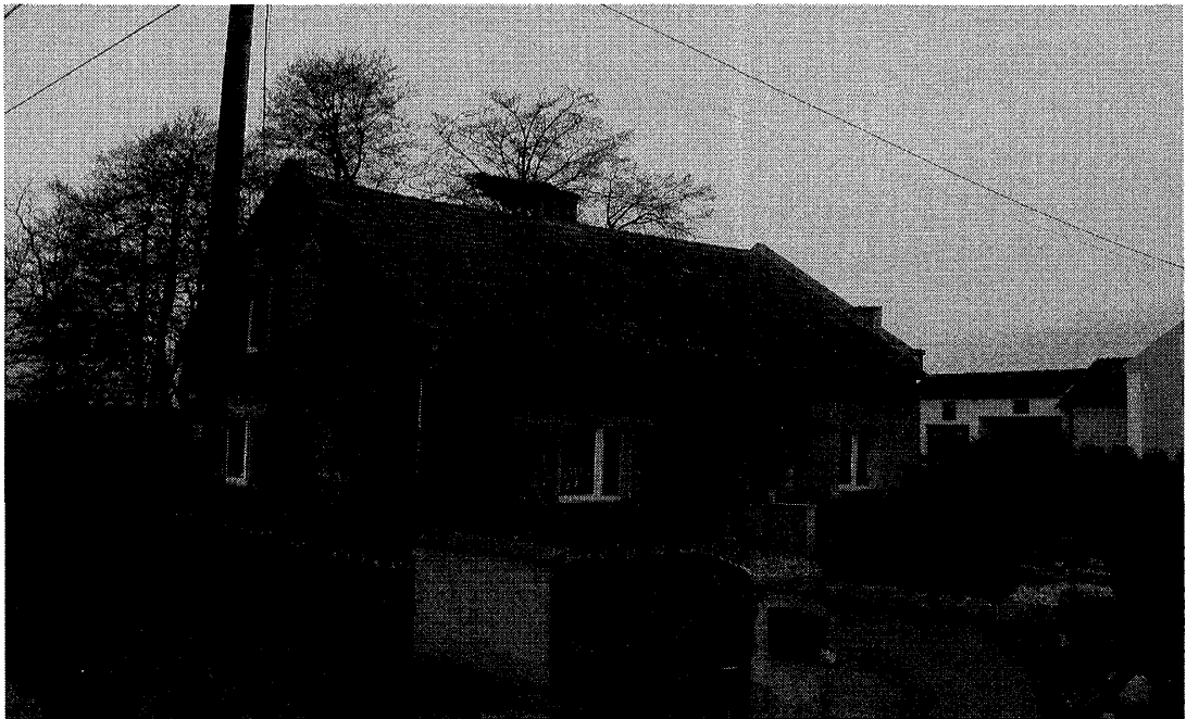
Rysunek 2. Budynek mienia gminnego w Krępnej

Po dojechaniu do sołectwa Krępna ul. Odrzańska 6 , działka 3/3 o powierzchni 716 m/kw znajduje się dom zbudowany w początkach XX wieku w ocenie zwiedzających zadbane remontowany na bieżąco w miarę możliwości z uporządkowanym obejściem przez wynajmujących własnym sumptem bez jakiegokolwiek wsparcia finansowego z Urzędu Miejskiego .( wniosek nr 5. )